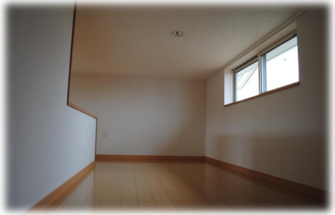
寝室内のロフト。収納スペースとして活躍