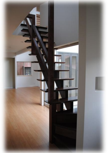
リビングから2階へ上がる オープン階段