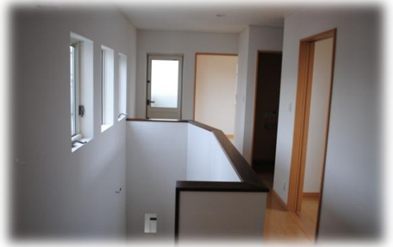
2階廊下も窓からの光が差し込む