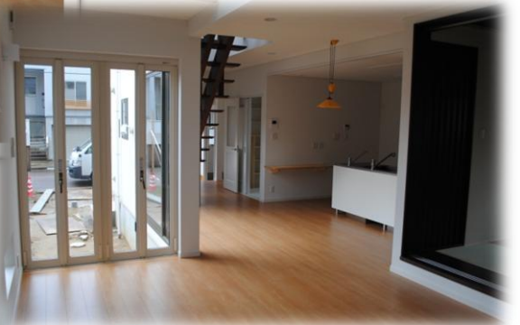
光と空間的なゆとりが魅力的な吹き抜けのリビング