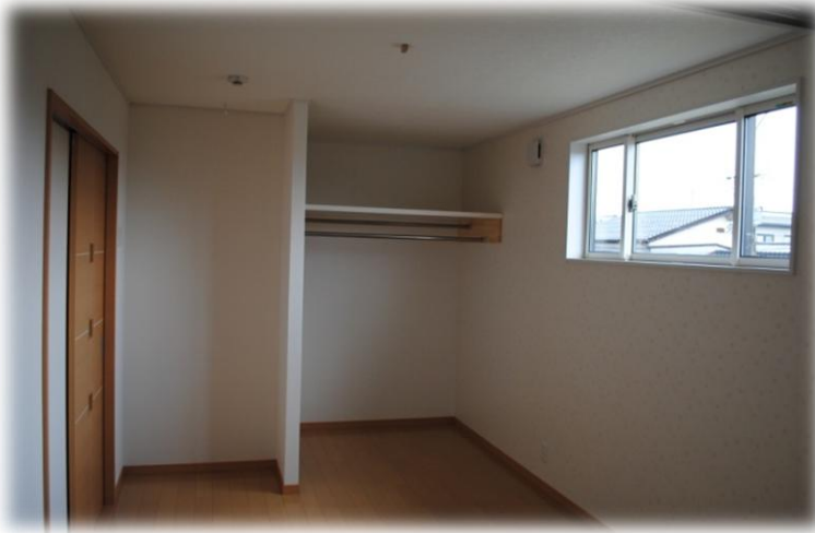
2階子供部屋。クローゼットは湿気がこもらないように、扉はない。