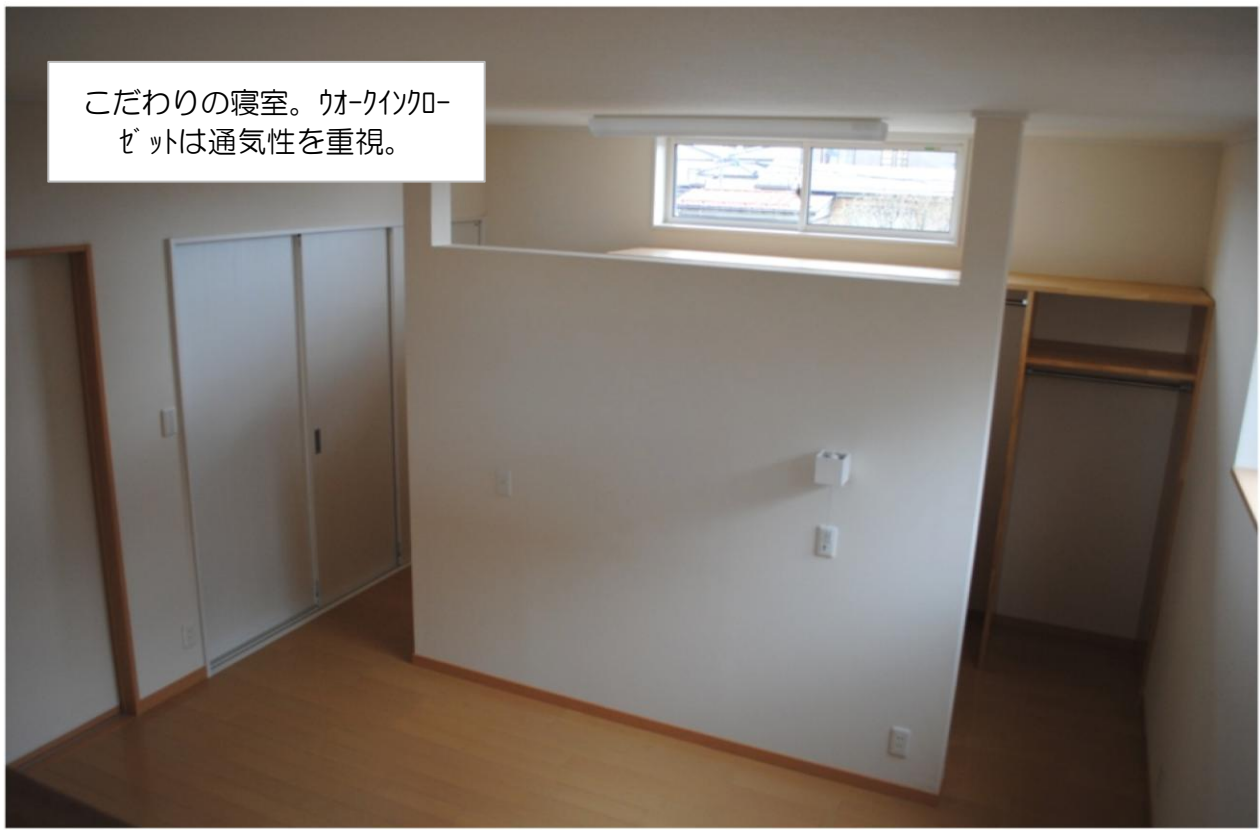
こだわりの寝室。ウォークインクローゼットは通気性を重視。