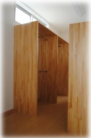
ウォークインクローゼットの棚は可動式で自由自在