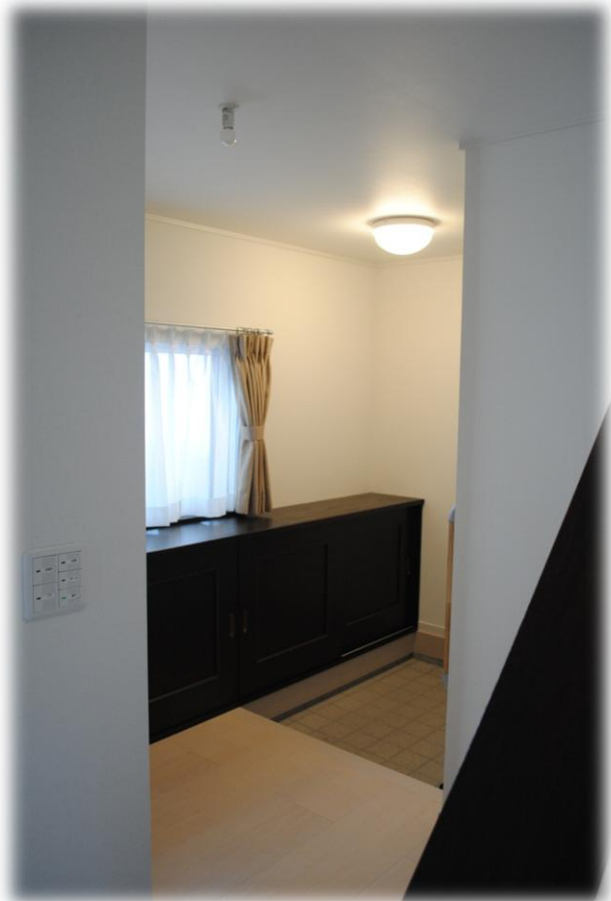
玄関を入ると広々としたホールがある。