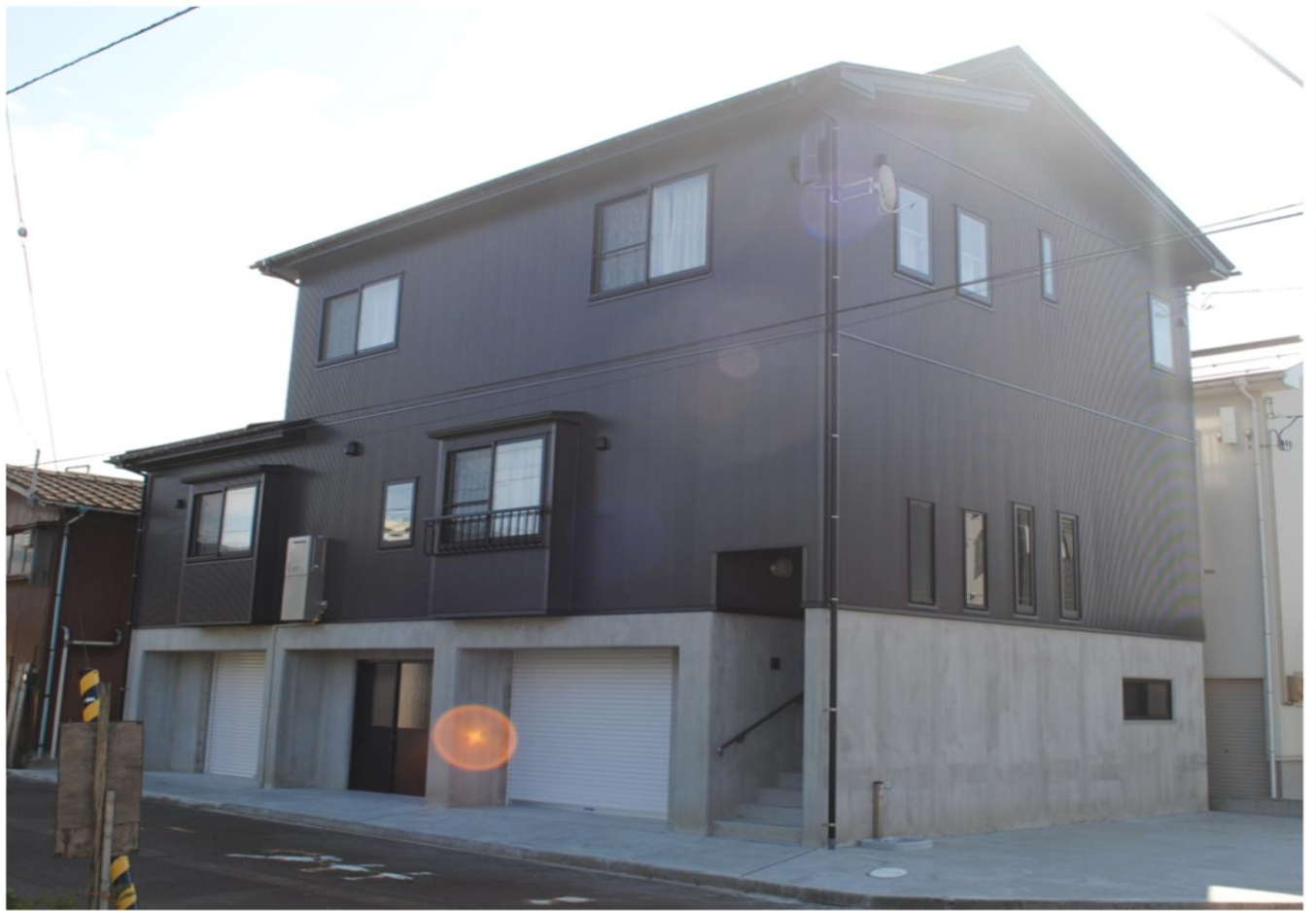
高床式のシンプルなお外観。