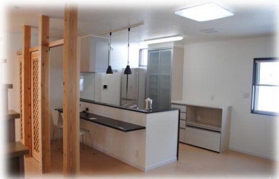
対面式キッチンにカウンターを付け、食事ができるようになっている。