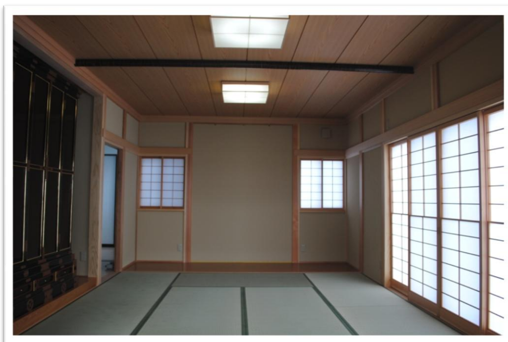
板の間、床の間完備の広々とした日本和室