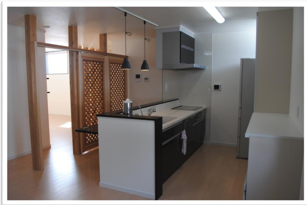
リビングとキッチン間にラティスを取付け状況にあわせて視界を遮れるように工夫されている。