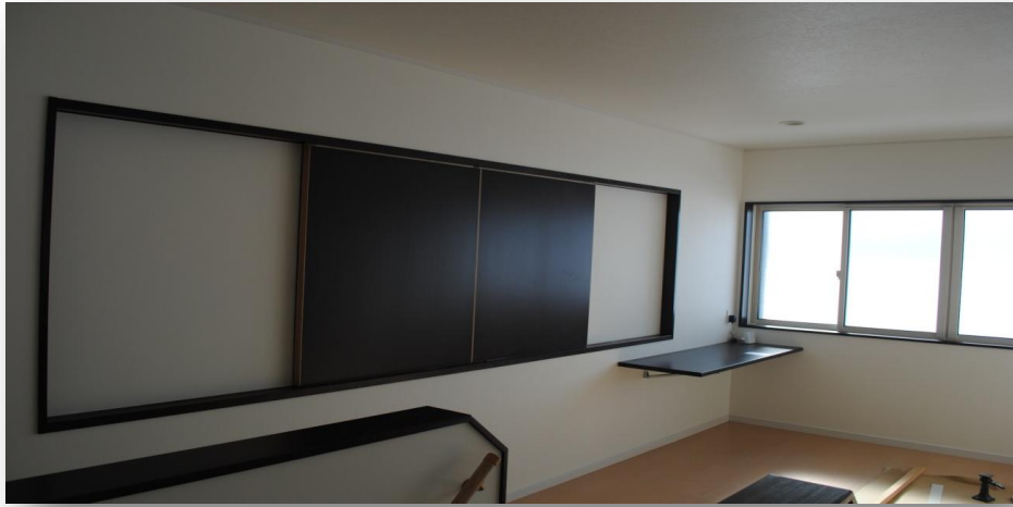
2階サンルームスペース。引き戸を開ければリビングを見下ろせます。