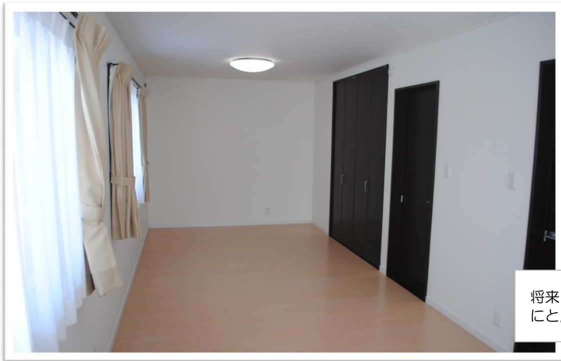
将来2部屋にできるようにと広々とした子供部屋